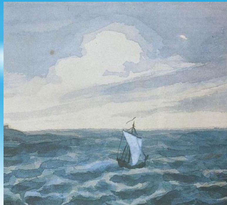
Рисунок Лермонтова «Парус», акварель, 1828-1832