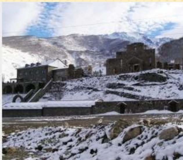
Восстанавливаемый на месте старого Аланский м монастырь