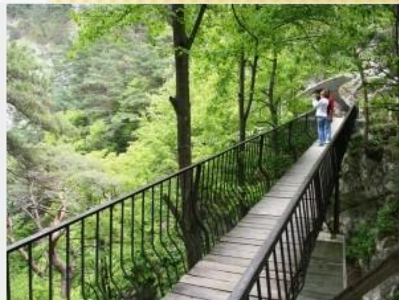
На тропе чудес