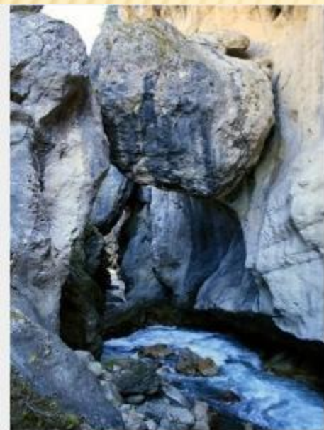
Теснина реки Фиагдон