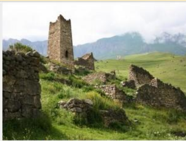
Фамильные башни в ауле Цымит