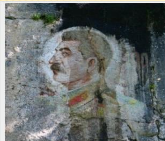
Портрет Сталина на скале