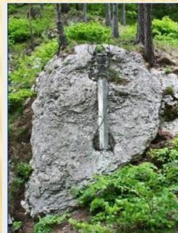
Меч кровников на Тропе чудес