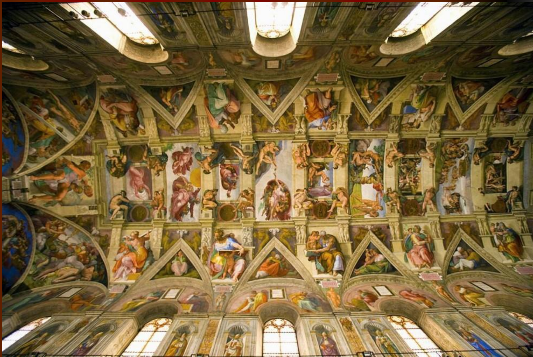
потолок Сикстинской капеллы Микеланджело Буонарrotти