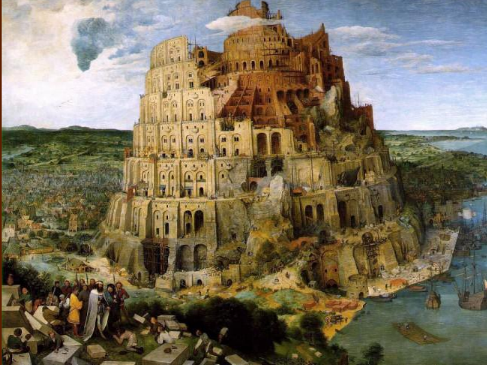
Питер Брейгель Старший. «Вавилонская башня» 1563.