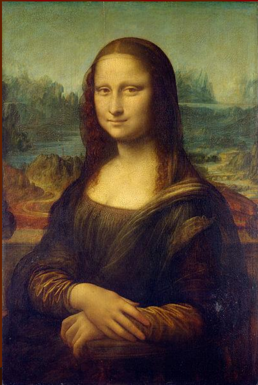
Леонардо да Винчи «Мона Лиза» (1503—1505/1506)