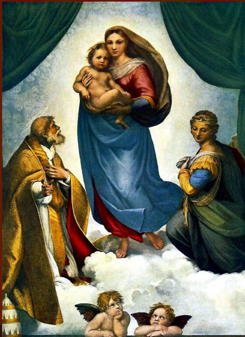
Рафаэль Санти «Сикстинская Мадонна»