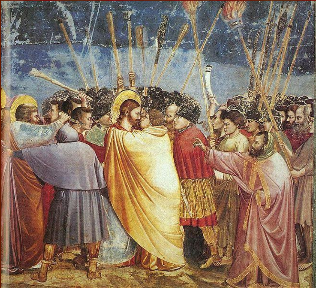
Джотто ди Бондоне «Поцелуй Иуды»