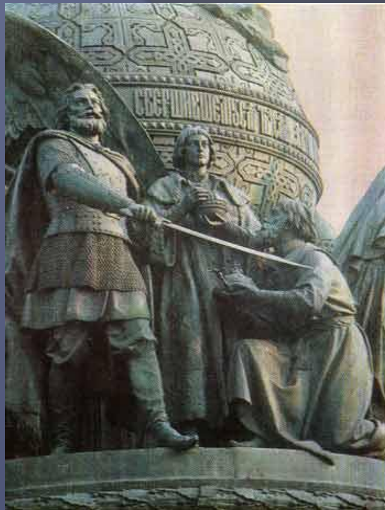
Памятник «Тысячелетие России» в Великом Новгороде