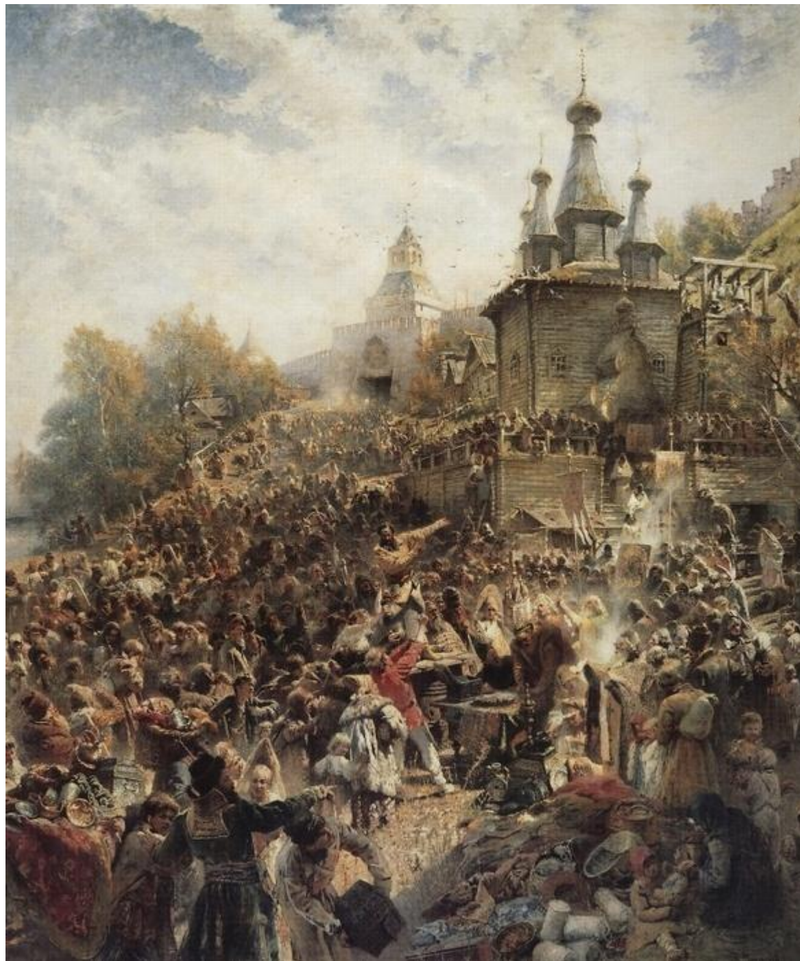
К.Маковский. Воззвание Минина и Пожарского