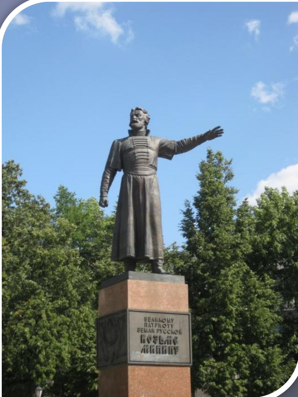
Памятник Минину в Нижнем Новгороде на площади Минину и Пожарскому