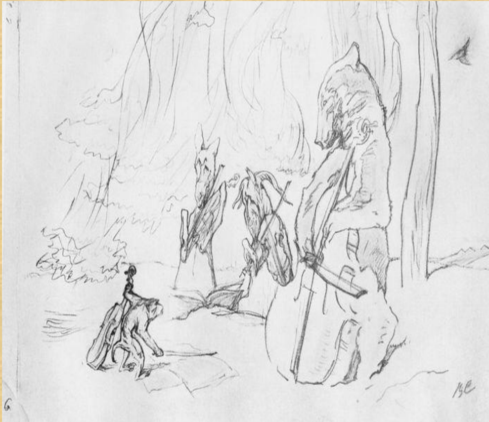
«Квартет». Иллюстрация В. Серова