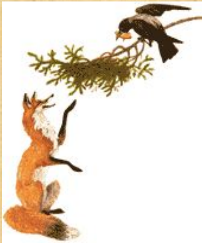
«Ворона и лисица»