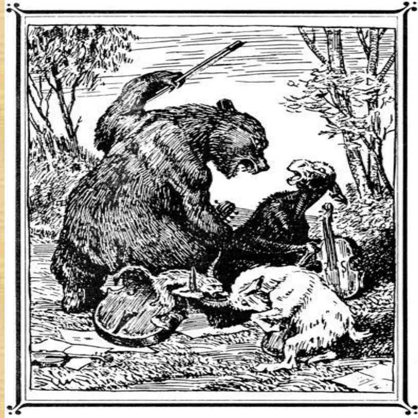
«Квартет». Иллюстрация А.Лаптева.