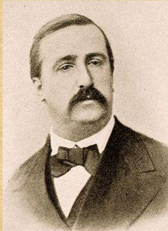
Александр Порфирьевич Бородин (1837-1887)