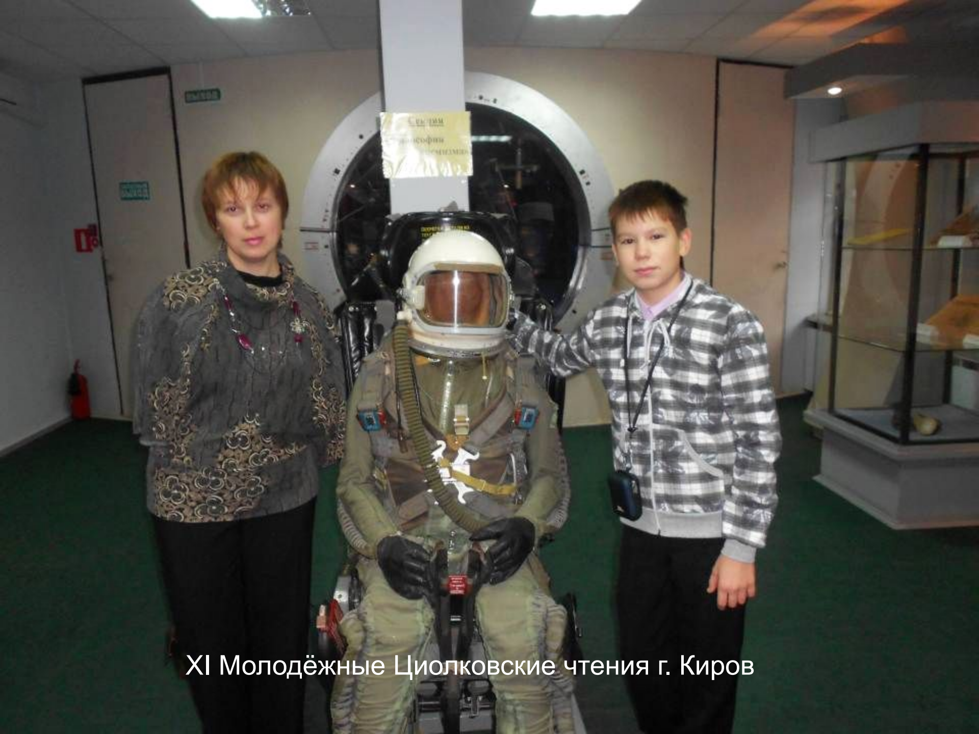
XI Молодёжные Циолковские чтения г. Киров