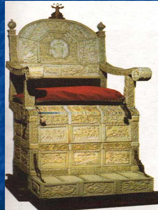
Трон Ивана Грозного