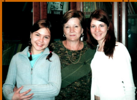
директор гимназии №3 2004 г.