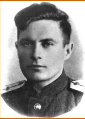
Лейтенант, 1944 г.