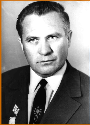
Учитель черчения, 1969 г.