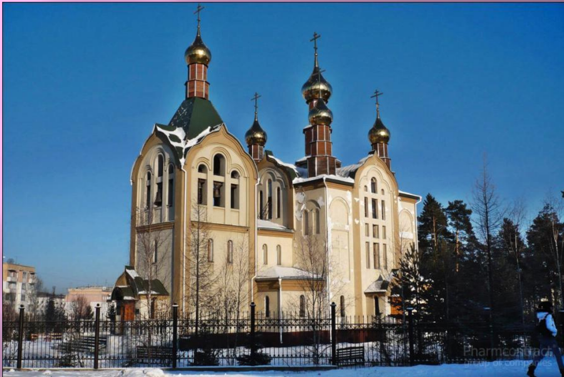
Храм Казанской иконы Божией Матери