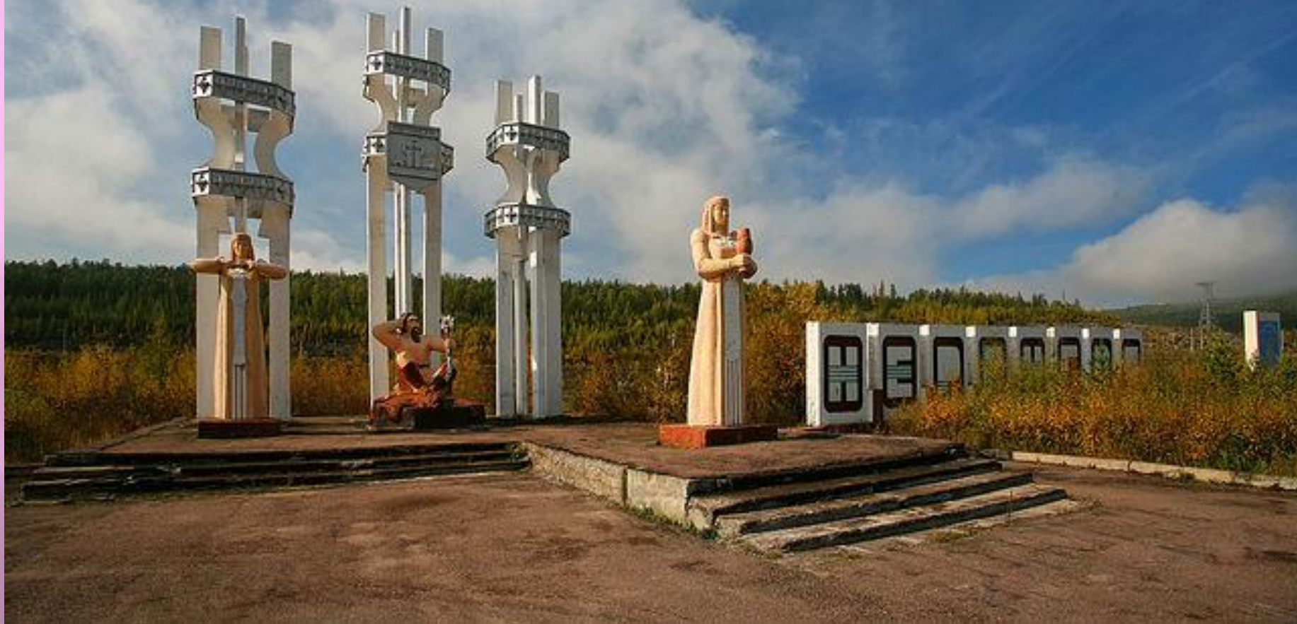
Скульптурный комплекс «Олонхосут»