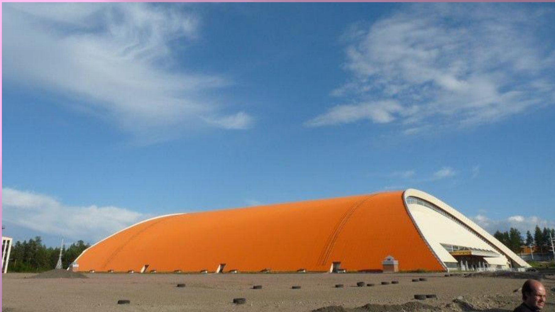
СПОРТИВНЫЙ КОМПЛЕКС «Горняк»