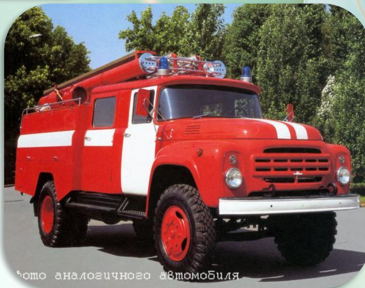
фото аналогичного автомобиля