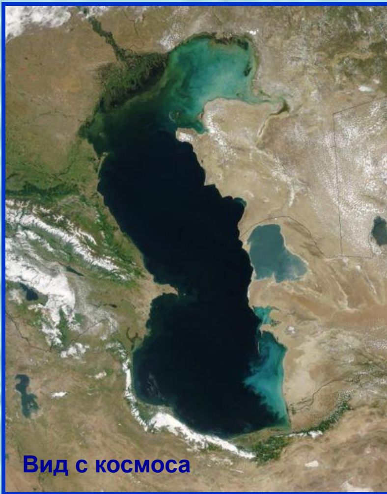
Вид с космоса

Самое большое бессточное озеро-море, омывающее Берега России и других стран.