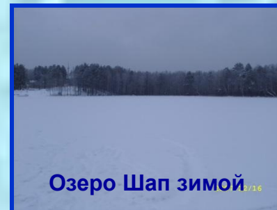
Озеро Шап зимой

Детские лагеря «Подснежник», «Кооператор» расположены на берегу озера Шап