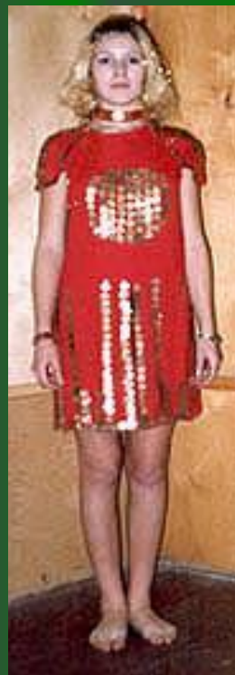
«Воспоминания о битве»