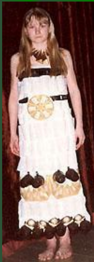
«Египтянка» (пластиковая посуда)