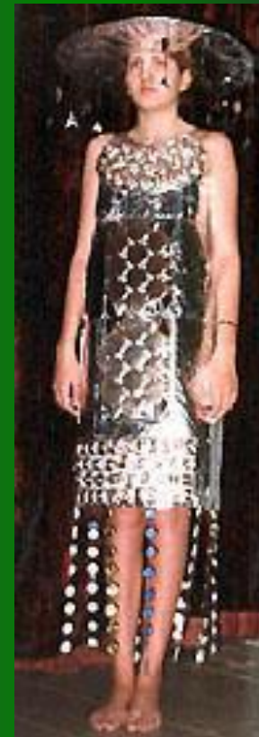
«Инопланетянка» (пластик, пробки)