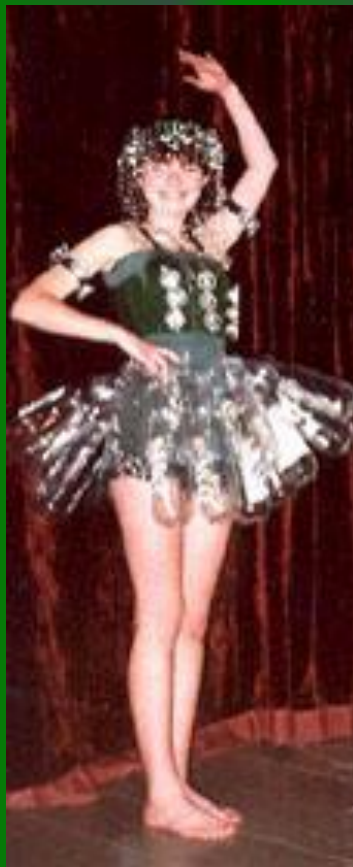
«Стеклянная статуэтка» (пластик, бумага)