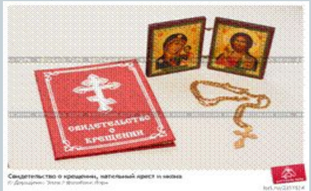
Святотелство о крещении, патисанный крест и иконы