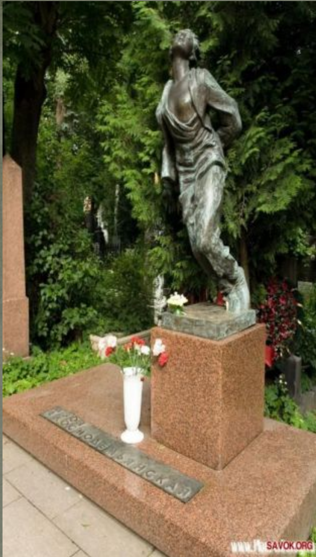
Могила Зои Космодемьянской на Новодевичьем кладбище