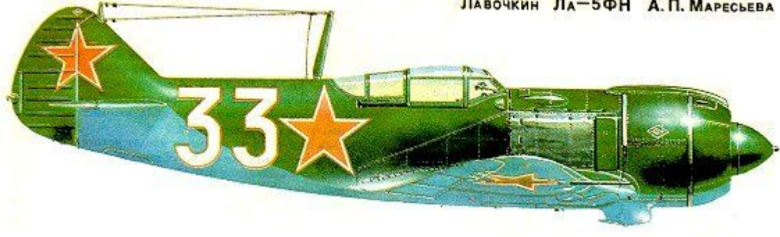
Лавочкин Ла-5ФН А. П. Маресьева

Из-за тяжёлого ранения во время Великой Отечественной войны ему были ампутированы обе ноги. Однако, несмотря на инвалидность, лётчик вернулся в небо и летал с протезами. Всего за время войны совершил 86 боевых вылетов, сбил 11 самолётов врага: четыре — до ранения и семь — после. Маресьев — прототип героя повести Бориса Полевого «Повесть о настоящем человеке».