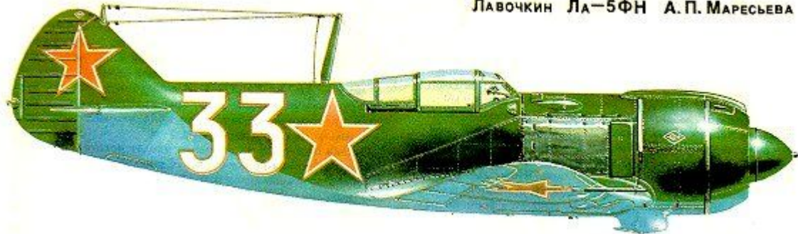
Лавочкин Ла-5ФН А. П. Маресьева

Из-за тяжёлого ранения во время Великой Отечественной войны ему были ампутированы обе ноги. Однако, несмотря на инвалидность, лётчик вернулся в небо и летал с протезами. Всего за время войны совершил 86 боевых вылетов, сбил 11 самолётов врага: четыре — до ранения и семь — после. Маресьев — прототип героя повести Бориса Полевого «Повесть о настоящем человеке».