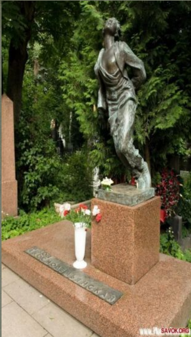
Могила Зои Космодемьянской на Новодевичьем кладбище