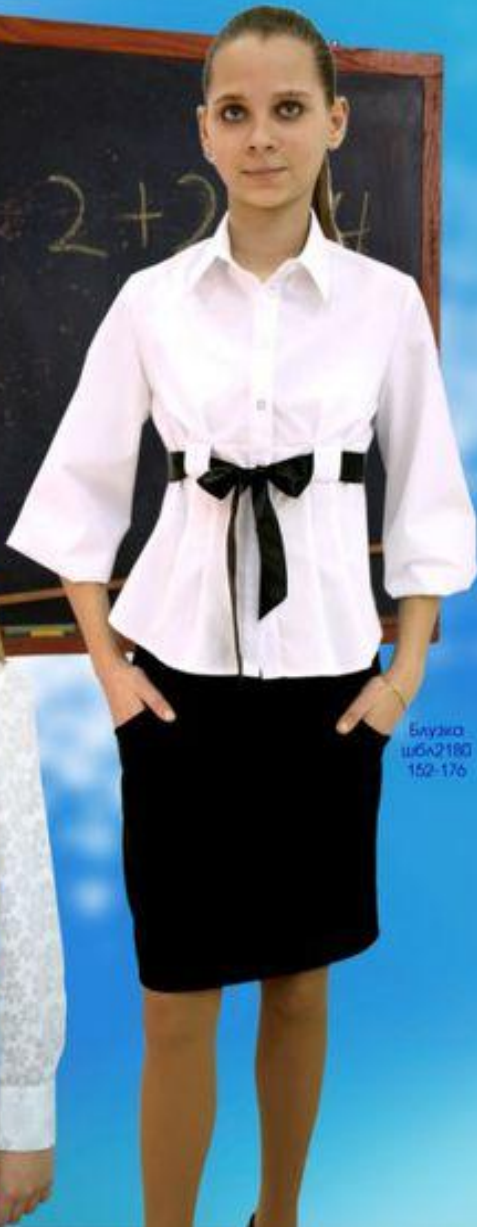
Блузка шбл2180 152-176