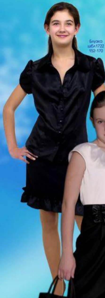
Блузка шбл1722 152-170