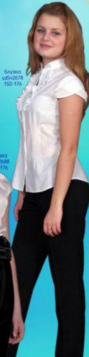
Блузка шбл2678 152-176