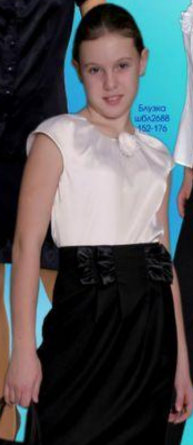
Блузка шбл2688 152-176