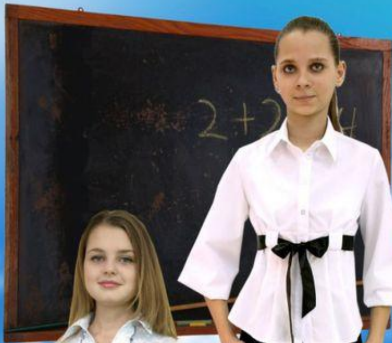
Блузка шбл2450 152-176