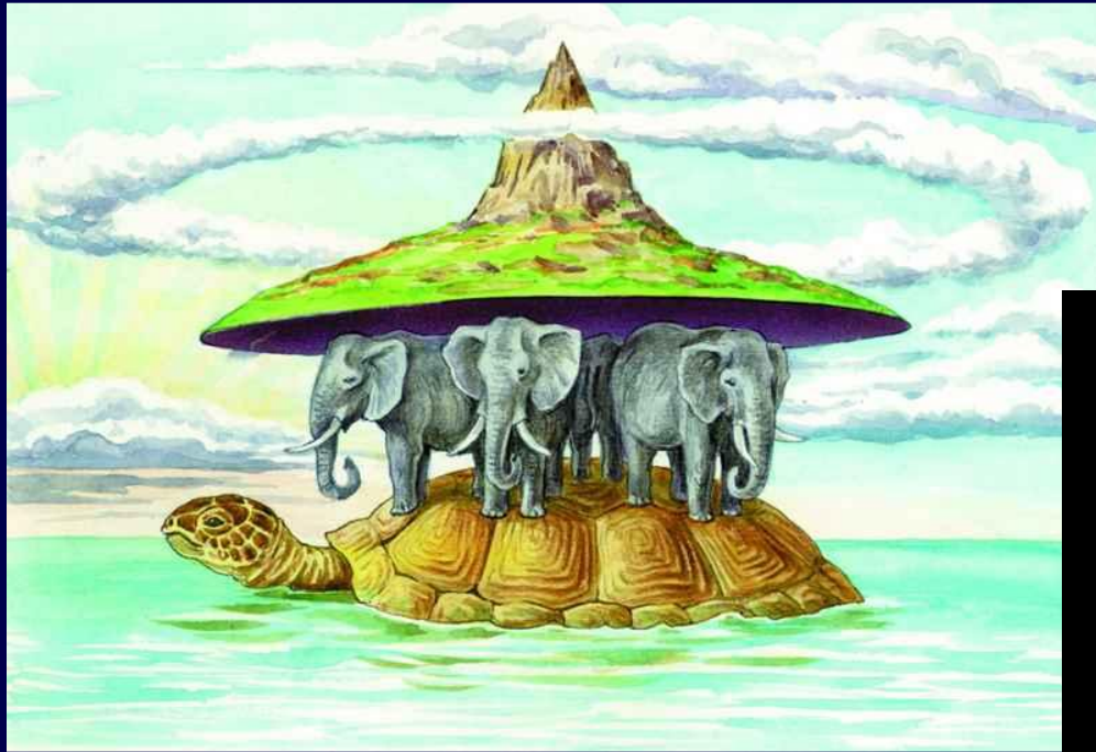
Представление в древности