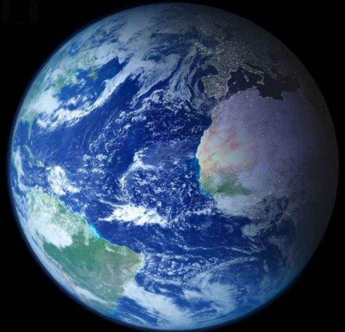
Вид Земли из космоса