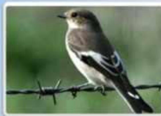
Мухоловка - пеструшка