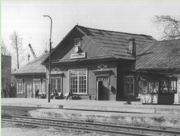
Деревянный вокзал (в настоящее время в этом здании находится багажное отделение)

Дивен край мой родной В дымке белых ночей. Этот город - герой Без надутых речей.