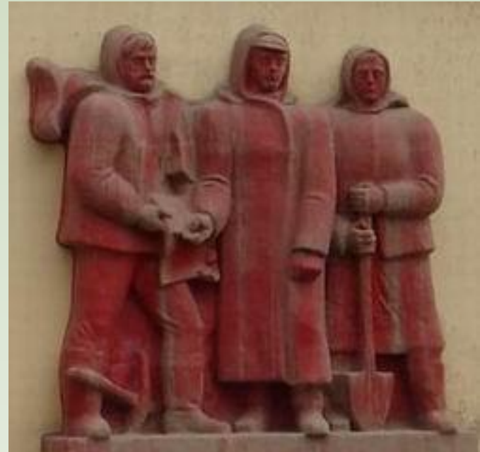
Памятник первостроителям города, воздвигнутый в 1978 году

Скорее! Скорее! Вот лозунг тех дней. 22 ноября 1936 года стройка получила транспортную связь со страной. Руководству области направлено сообщение о том, что по вновь построенной ветке Судострой - Исакогорка прошёл первый поезд с грузом.