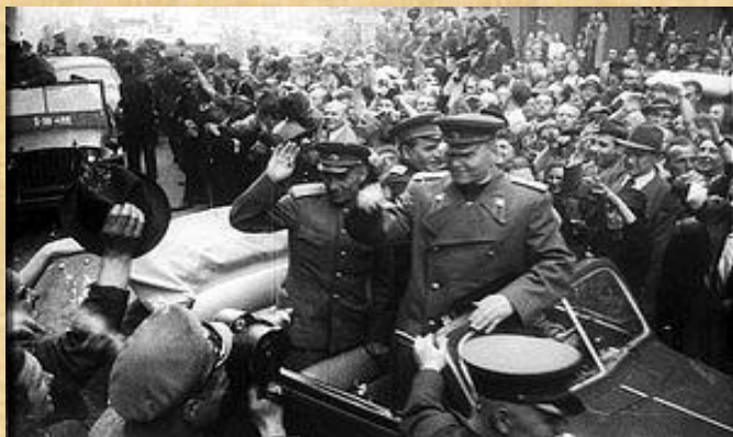
И.С.Конев в Праге, 1945 г.

Второй медалью «Золотая Звезда» маршал Конев И. С. награждён 1 июня 1945 года за образцовое руководство войсками в завершающих операциях Великой Отечественной войны.