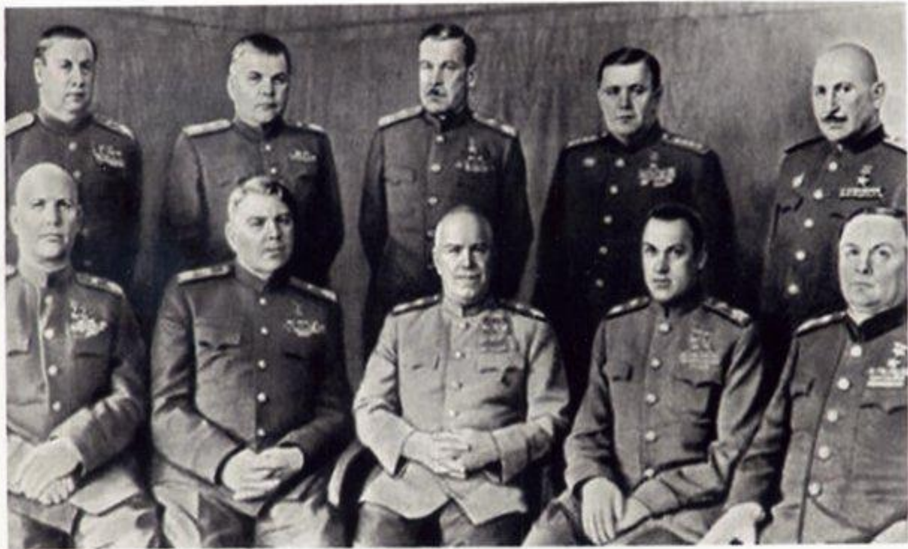
Полководцы Великой Отечественной войны. Командующие фронтами в годы Великой Отечественной войны И. С. Конев, А. М. Василевский, Г. К. Жуков, К. К. Рокоссовский, К. А. Мерецков (сидят, слева направо), Ф. И. Толбухин, Р. Я. Малиновский, Л. А. Говоров, А. И. Еременко, И. Х. Баграмян (стоят, слева направо).