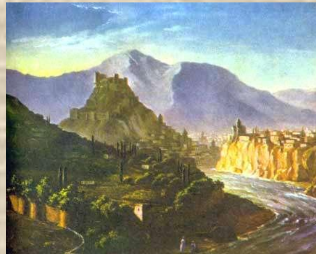
М. Ю. Лермонтов «Вид Тифлиса».