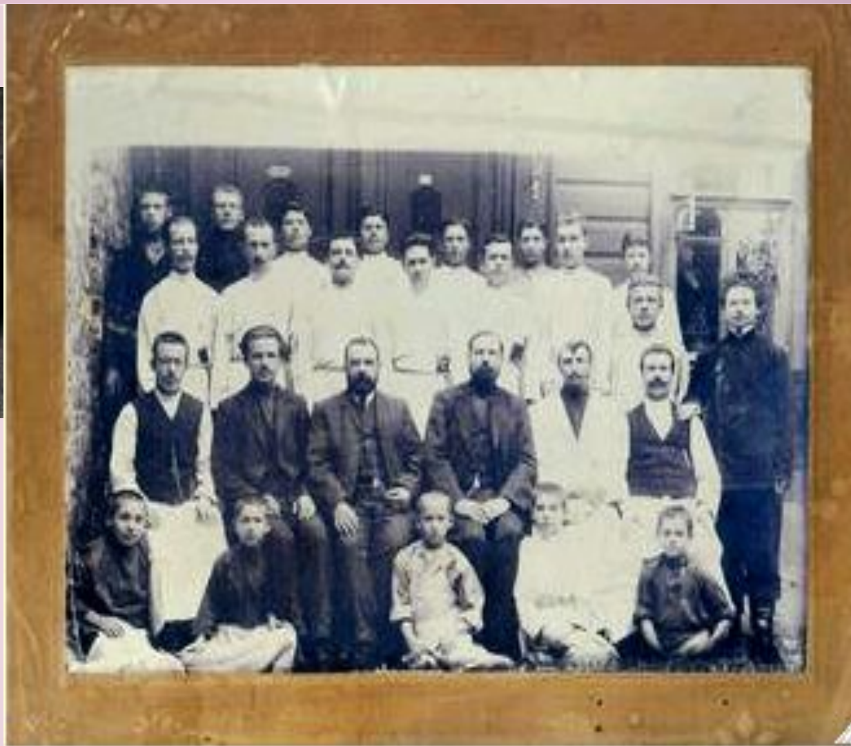
На снимке преподаватели, священники и лицеисты