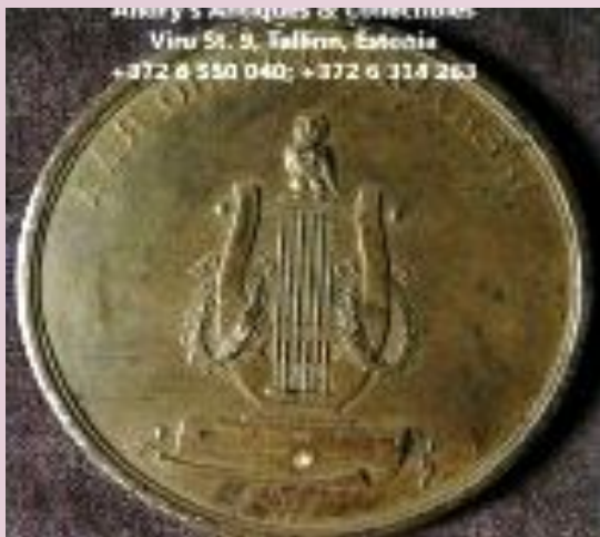
Медаль от Императорского Царскосельского лицея