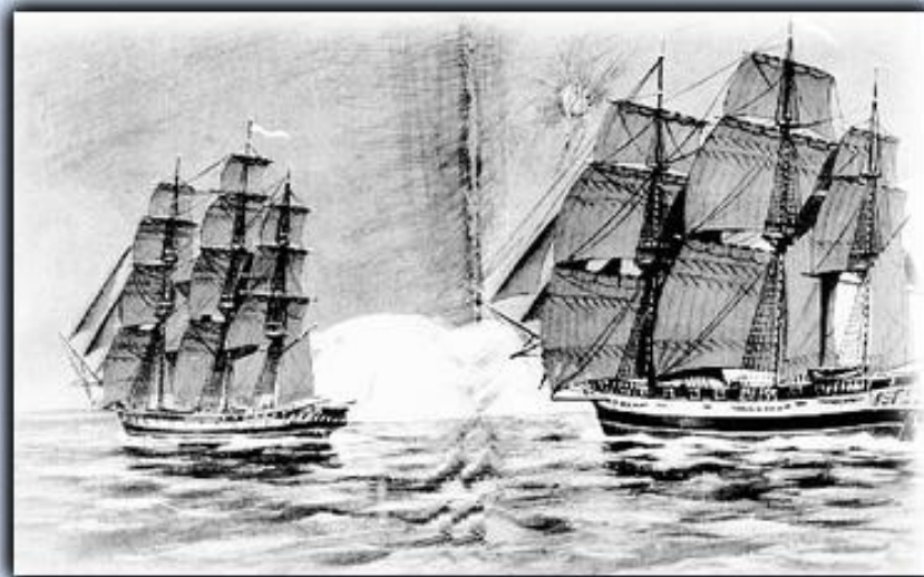
Шлюпы Восток и Мирный