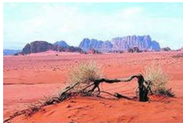
Испытка. Если не останутся вырубку леса, черные станут красные