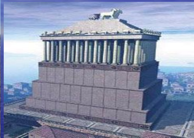
Мавзолей в Галикарнасе