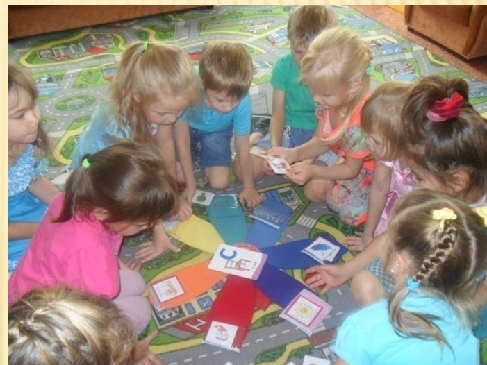
«Определи первый звук»