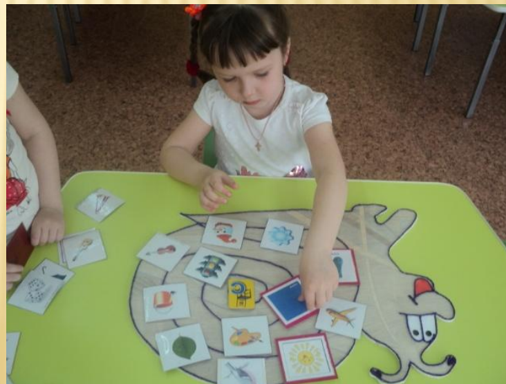
«Где живет звук»