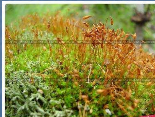
Кукушкин лен