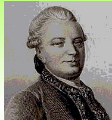
В. И. Майков