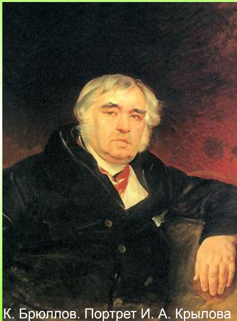
К. Брюллов. Портрет И. А. Крылова