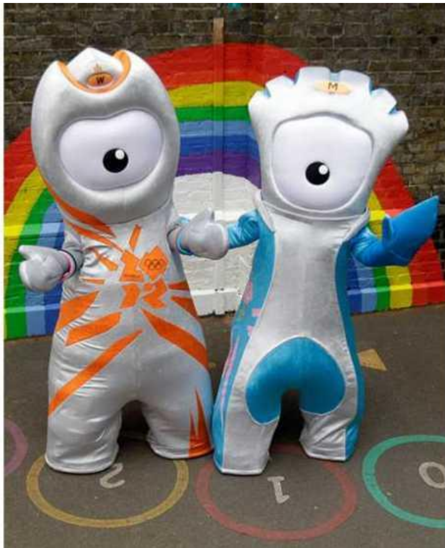
Уэнлок и МанDEVиль - талисманы лондонской Олимпиады.