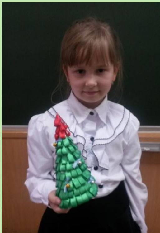
Елочка из ленточек