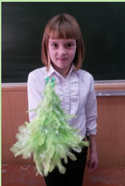
Елочка из перьев