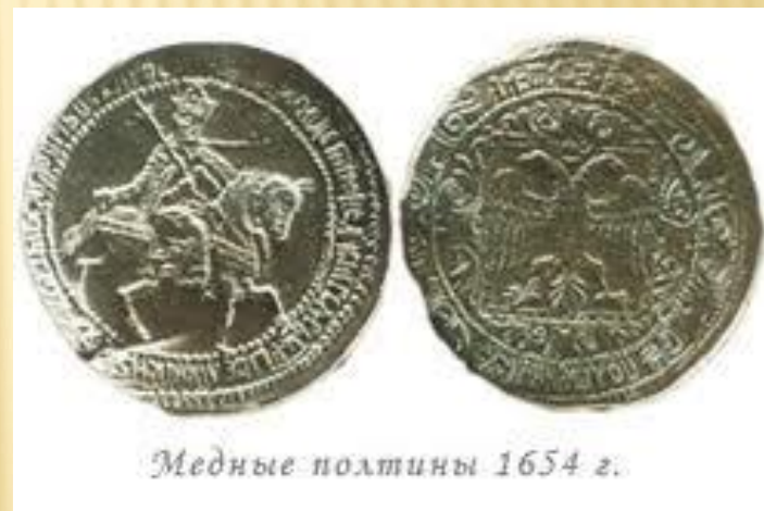
Медные полтины 1654 г.