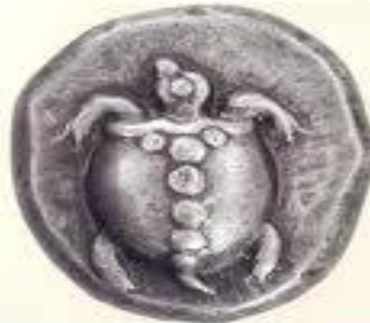
Статер Згнна, 480-е гг. до н.э. Серебро, диаметр 24 мм, вес 19 гр.