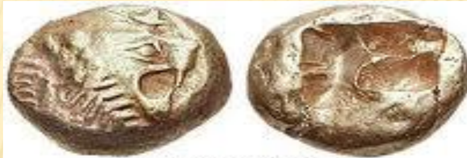
Лидийская монета, 610-600 гг. до н.э. Злектр, макс. размер 13 мм, вес 4,70 гр.