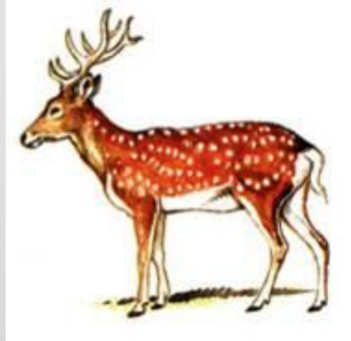
Уссурийский пятнистый олень