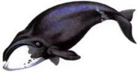
Гренландский (полярный) кит