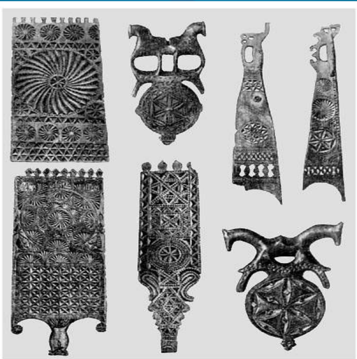
Рис. 85. ПРЕДМЕТЫ ДЛЯ ИЗГОТОВЛЕНИЯ ОДЕЖДЫ С СОЛНЕЧНОЙ СИМВОЛИКОЙ: