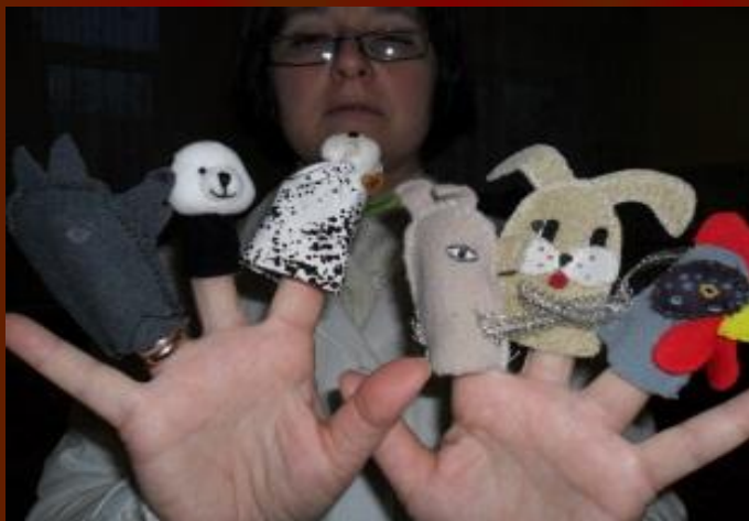
Знакомство с персонажами сказки