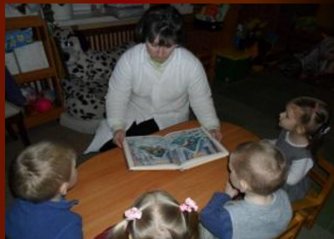
Чтение русской народной сказки «Заюшкина избушка»