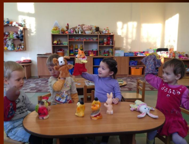
Рассматривание наглядного материала