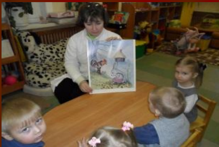
Рассматривание иллюстраций, картинок