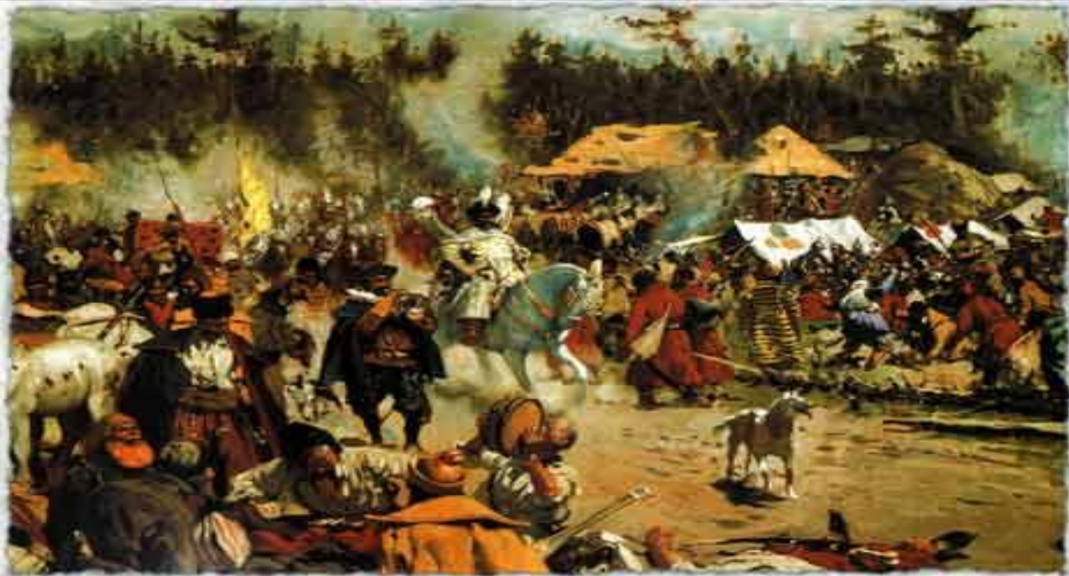
С. Иванов. Смутное время.

В эпоху Смутного времени одни правители сменяли других на русском престоле.