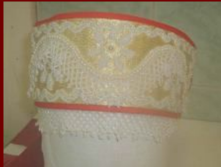
Девичий головной убор в современном исполнении