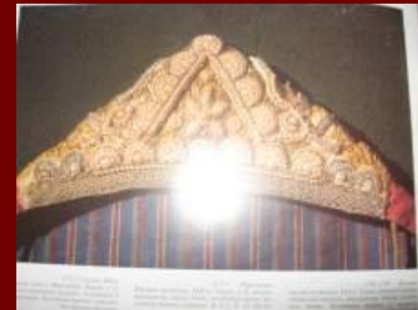
Сорока кон.19 века. Каргополье