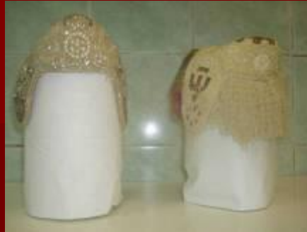
Головные уборы Каргополя и Мелентьевской волости