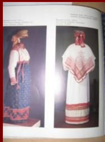
Женский костюм 19 век Вологодская губерния Тотемский уезд