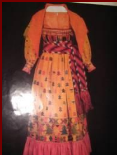
Женский костюм I половины 19 века Вологодская губерния Великоустюгский уезд