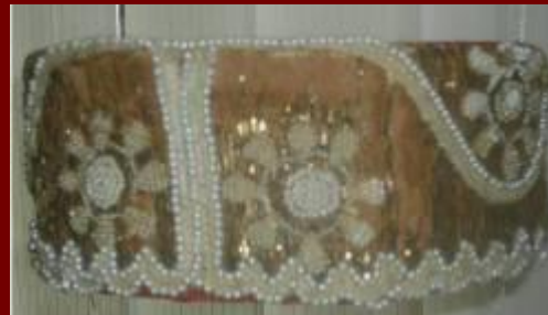
Девичий головной убор д. Шенкурская (Няндома)