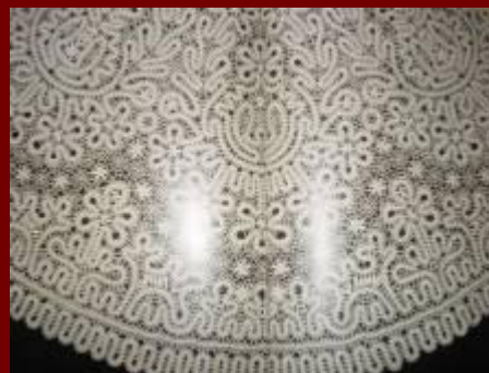
Кружевоплетение Вологодская губерния