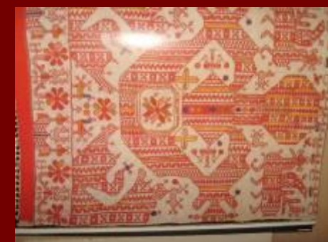
Конец полотенца. Холст, кумач, льняные и шерстяные нити