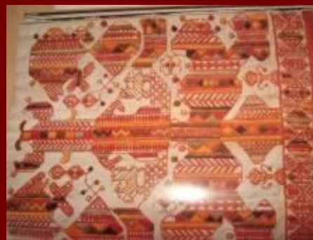
Фрагмент подола женской рубахи. Вышивка. Каргополье