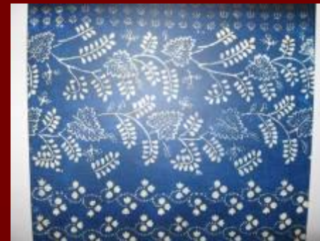
Кубовая набойка 19 век Вологодская губерния