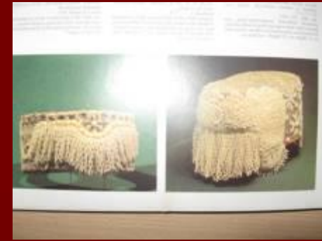
Перевязка, кокошник, украшенные жемчугом, бисером, перламутром