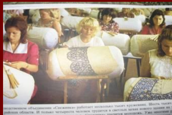
Представительном объединении «Снежинка» работает несколько тысяч круженин. Шестнадцать тысяч в районах области. И только четверть человек трудится в светлых цехах нового здания на территории объединения. Уже многие ре...