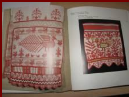
Нач.19 века, холст льняные, х/б, шелковые нити . Ажурное ткачество