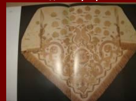
Плат «золотой» К.19 века. Шитье.Вышивка