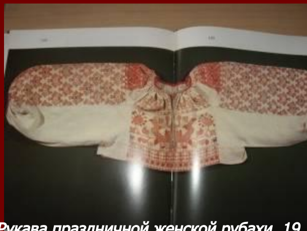
Рукава праздничной женской рубашки 19 век Олонецкая губерния Каргопольский уезд