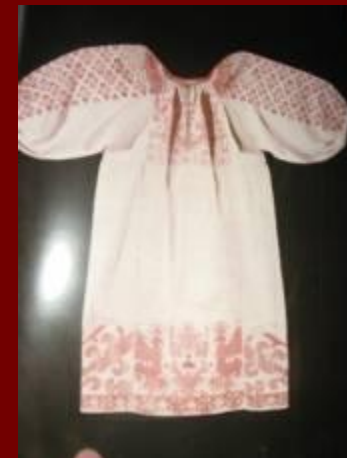
Праздничная женская рубаша нач.19 века Каргополье