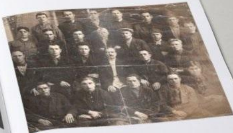
1937 год, прадед в нижнем ряду посередине