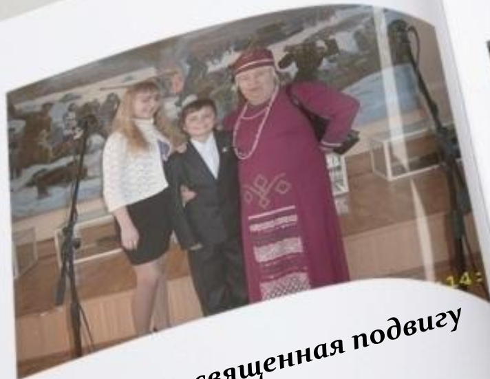
Картина, посвященная подвигу комиссара Быстрова