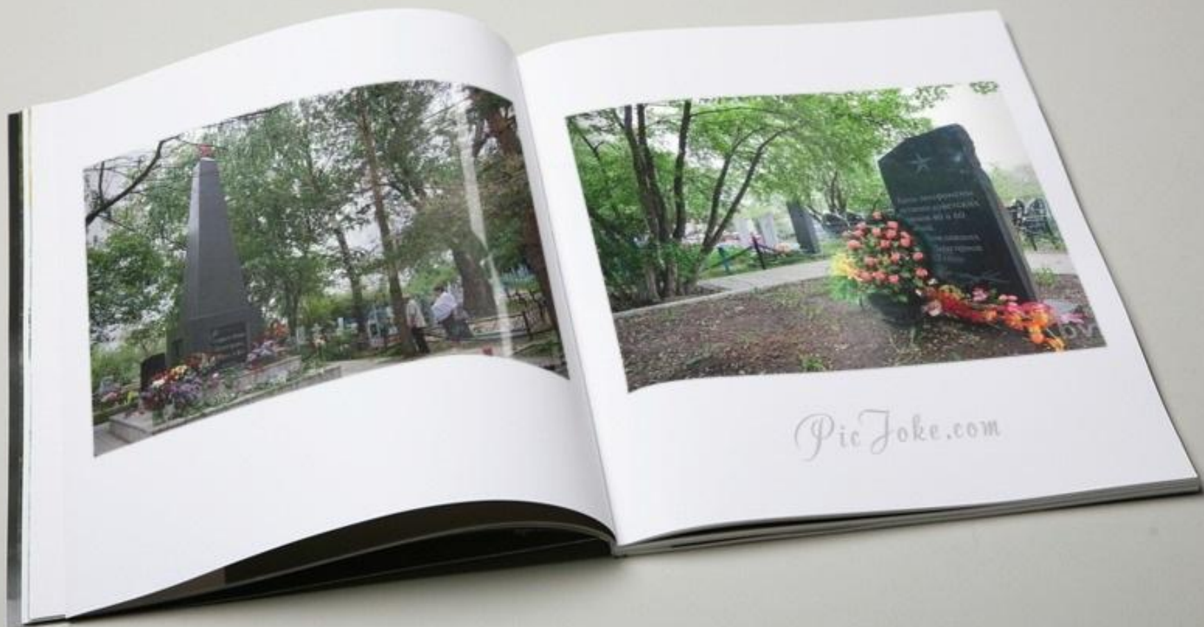
Воинское захоронение в с. Подгорное в наши дни