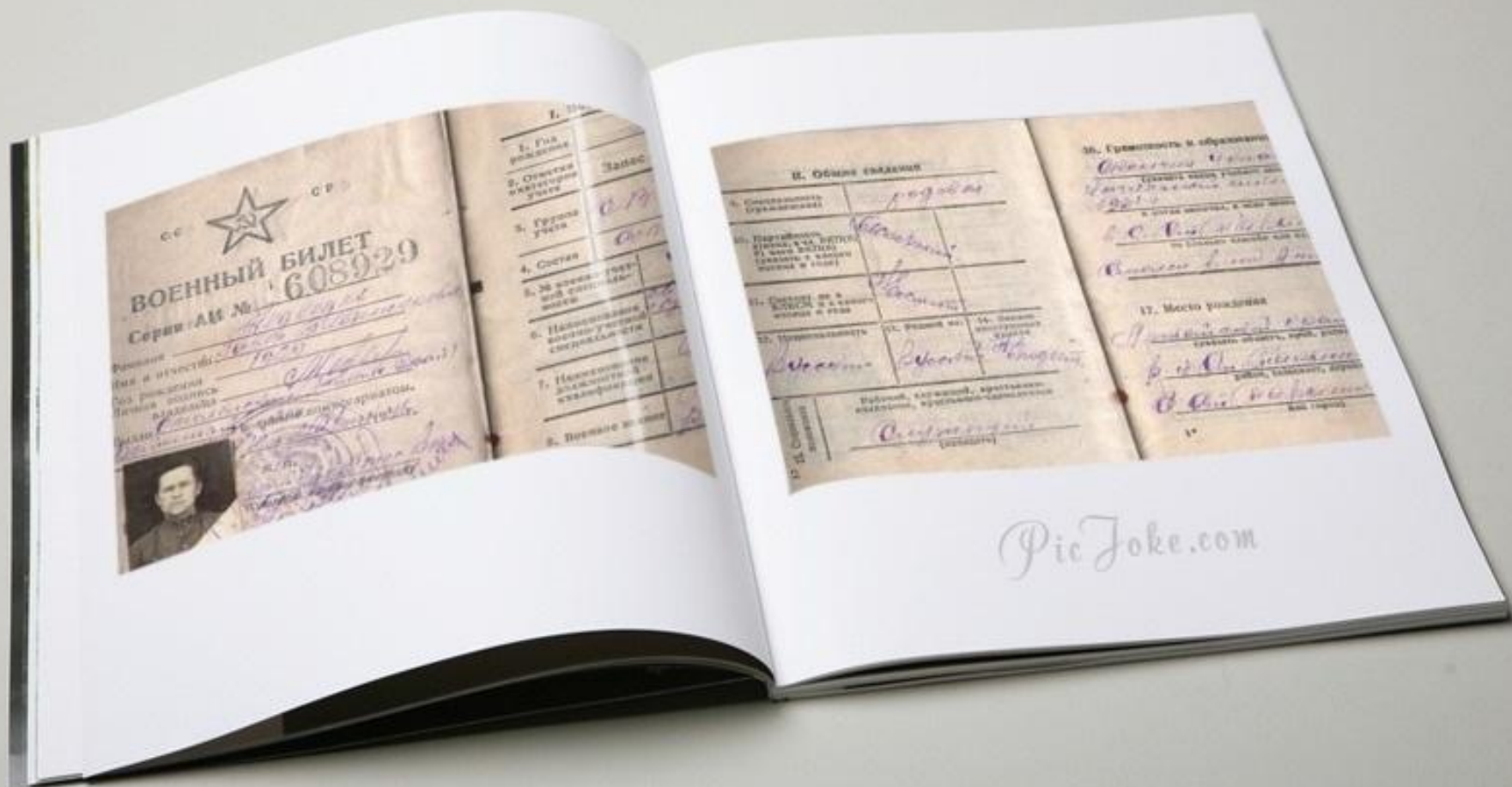
Военный билет прадеда, сохранившийся до сих пор