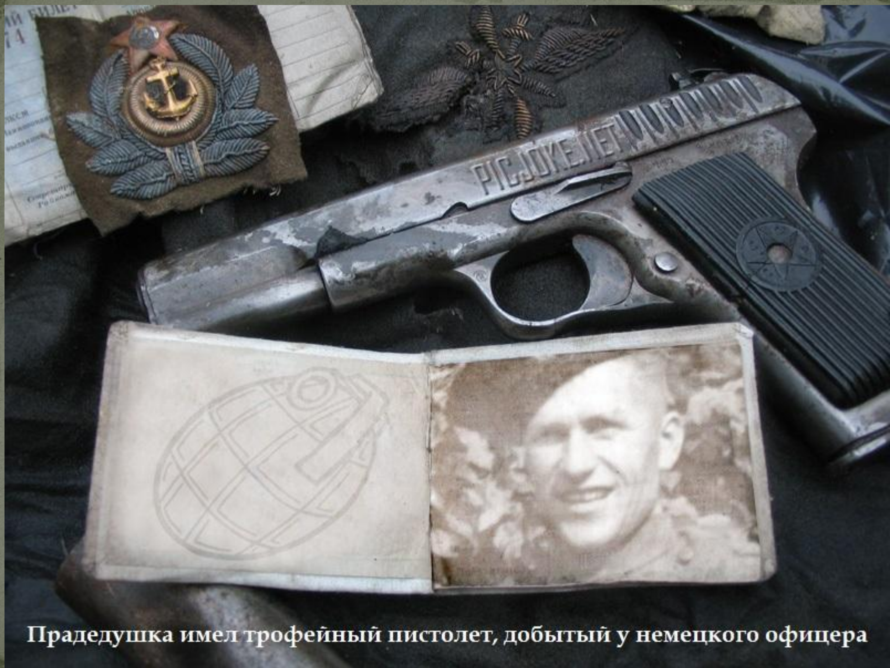
Прадедушка имел трофейный пистолет, добытый у немецкого офицера