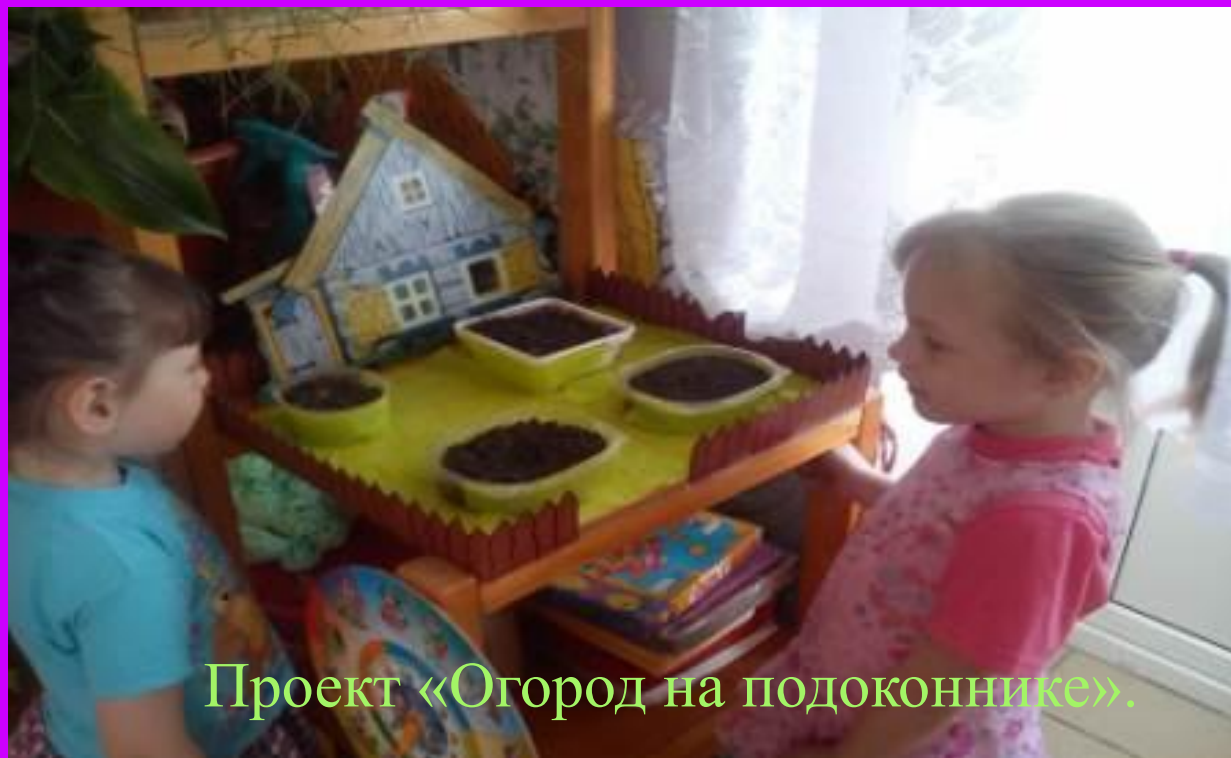
Проект «Огород на подоконнике».

В 2013 году мною был реализован проект «Огород на подоконнике» с детьми младшего дошкольного возраста, который показал на мой взгляд хорошие результаты. Его целью было - формирование экологической культуры у детей и их родителей, желание принимать участие в совместных с детьми мероприятиях.