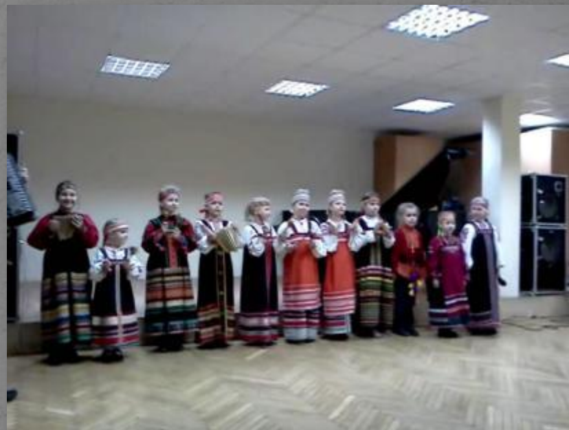
Концерт посвященный Дню Матери, 17 ноября 2011 г.