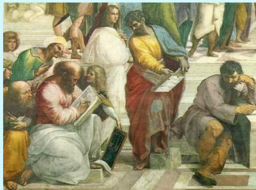
Боэций (слева) на фреске Рафаэля «Афинская школа»