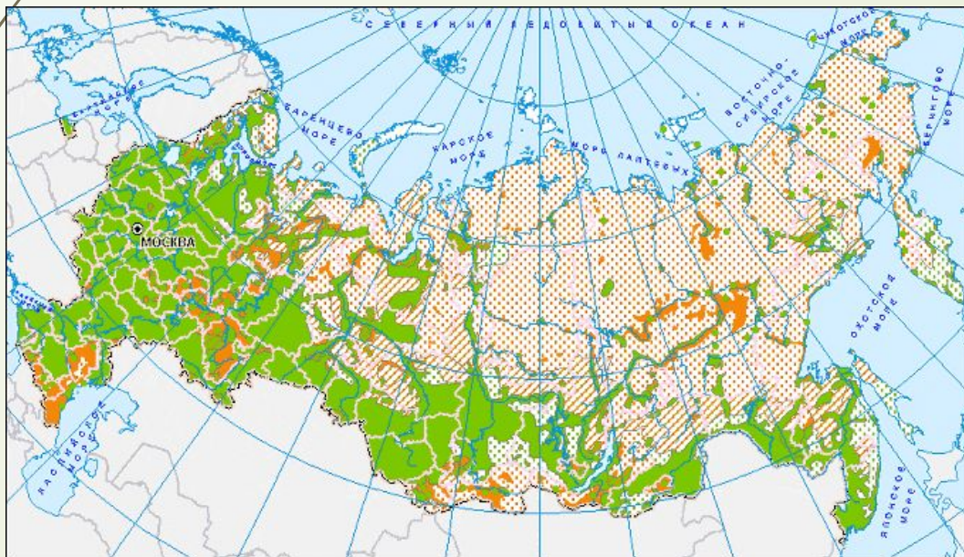
Распределение русскоязычного населения

Русские в России — русское население России. Русские являются наиболее многочисленным и государствообразующим народом России. По данным переписи населения русских всего 79,8 % населения России. Русские составляли более 50 % населения в 74 из 89 субъектов Российской Федерации. Доля мужчин среди русских в России — 46 %, женщин — 53 %. Доля городского населения — 77 %, сельского — 23 %. 99,8 % русских владеют русским языком