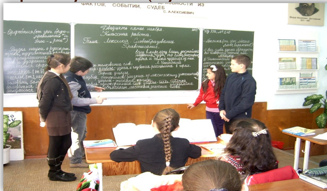
6 «В» класс

«...В детстве человек должен пройти эмоциональную школу - школу воспитания добрых чувств». (Сухомлинский В.А.)