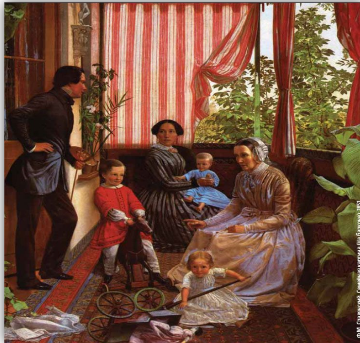
Ф.М. Славянский. Семейная картина (на балконе) 1851 г.

Семья - источник физических и нравственных сил человека, сложный институт человеческого бытия, и утверждение "счастлив тот, кто счастлив дома" не подлежит сомнению.