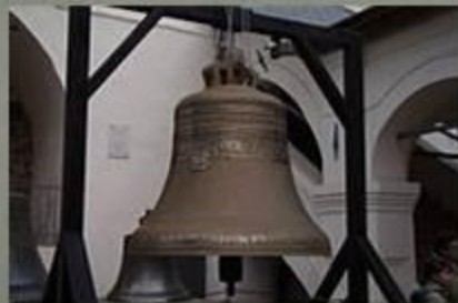
Колокол 1659 г.