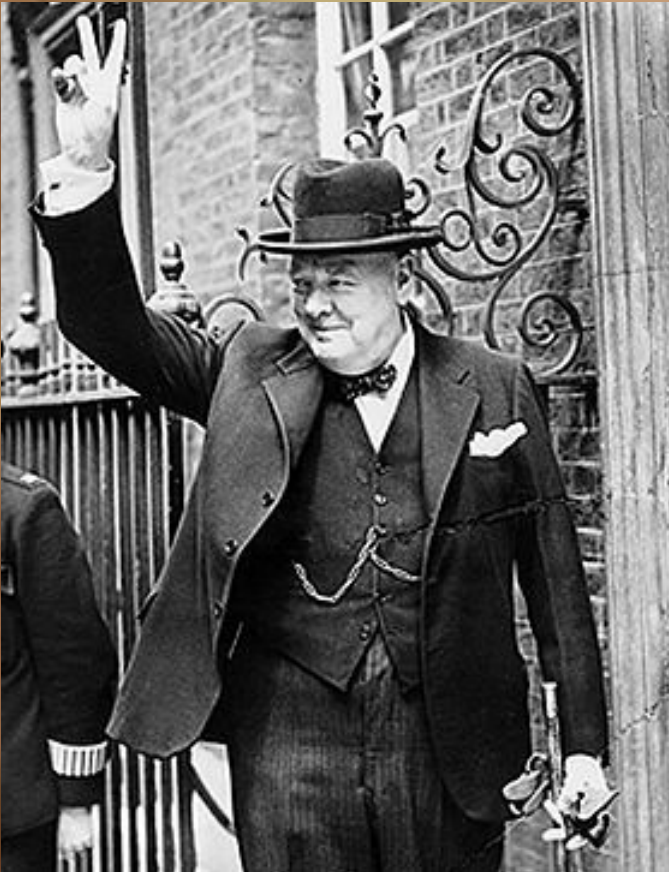
Уинстон Черчилль Winston Churchill