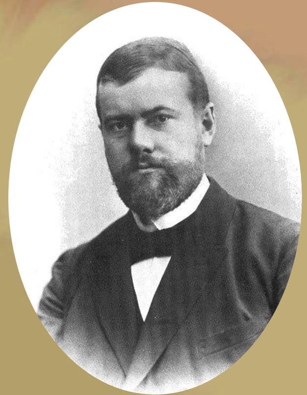
Макс ВЕБЕР (1864 – 1920) немецкий философ и социолог.