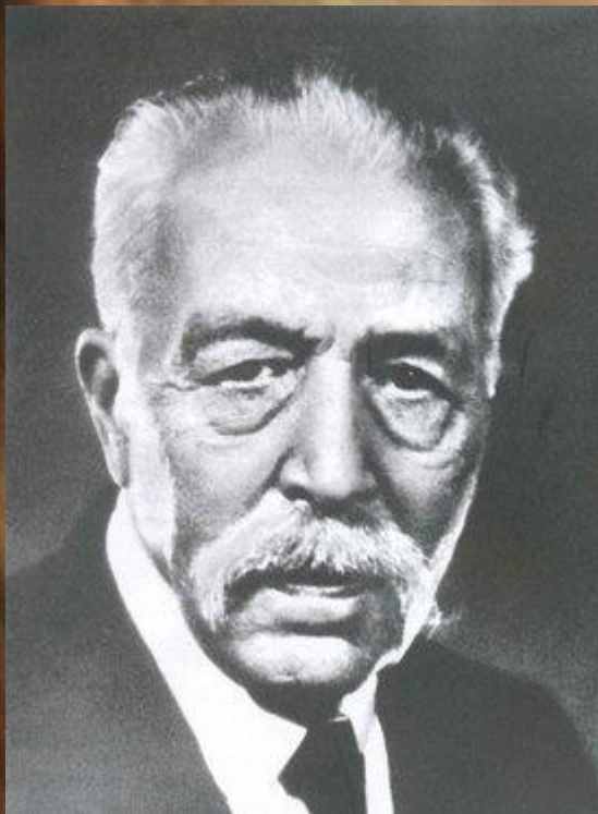
Гаэтано Моска (1858 -1941), итальянский юрист, социолог