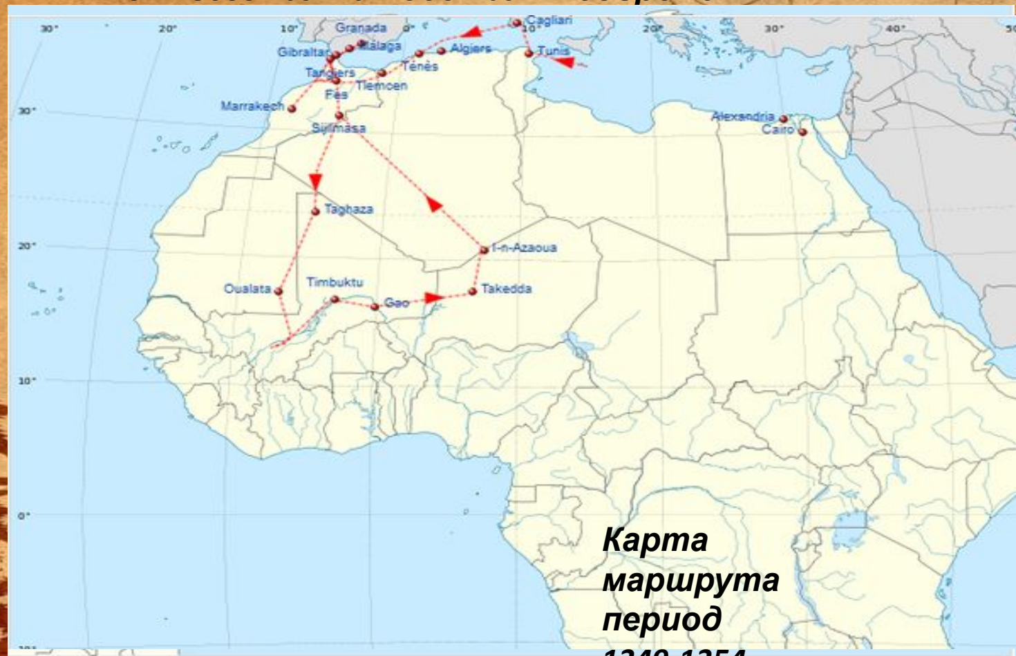
Карта маршрута период 1349-1354

Баттута За свою жизнь Ибн Баттута преодолел более чем 73000 миль и посетил 44 современных