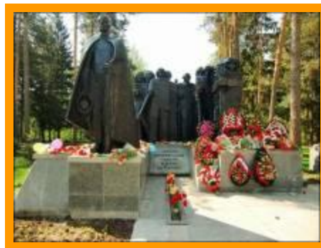
Бронепоезд «Илья Муромец».

В войну прошел путь от Мурома до Франкфурта-на-Одере