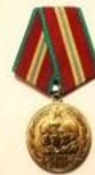
"70 ЛЕТ ВС СССР" 1988 г.