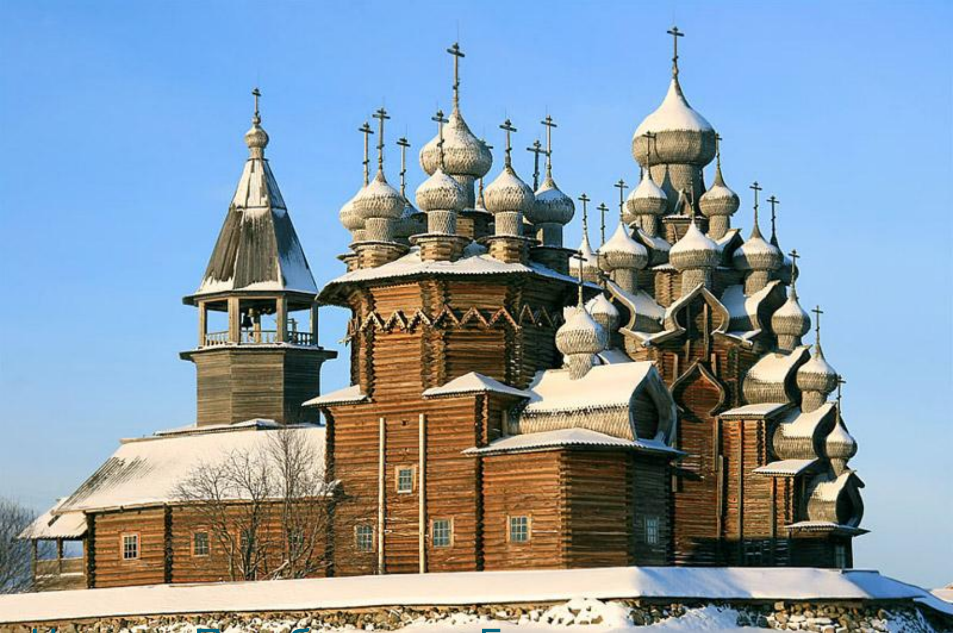
Церковь Преображения Господня на острове Киж