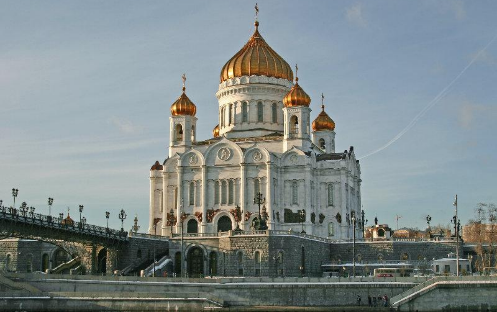
Храм Христа Спасителя