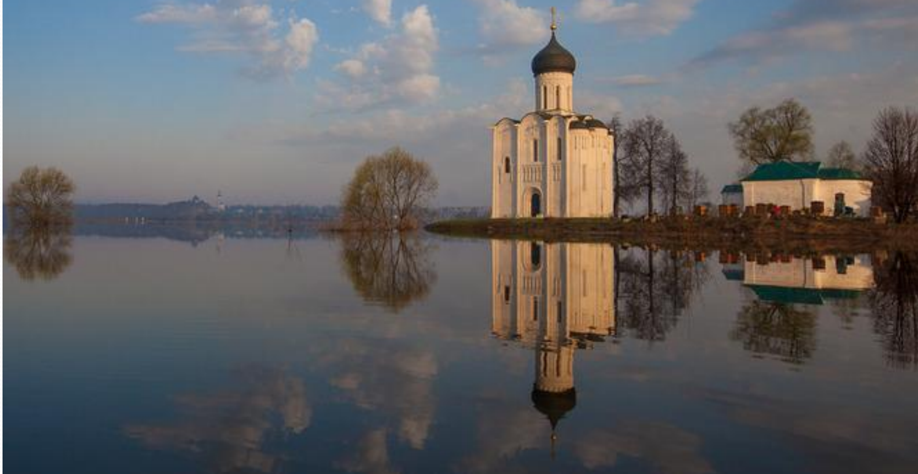
Церковь Покрова на Нерли