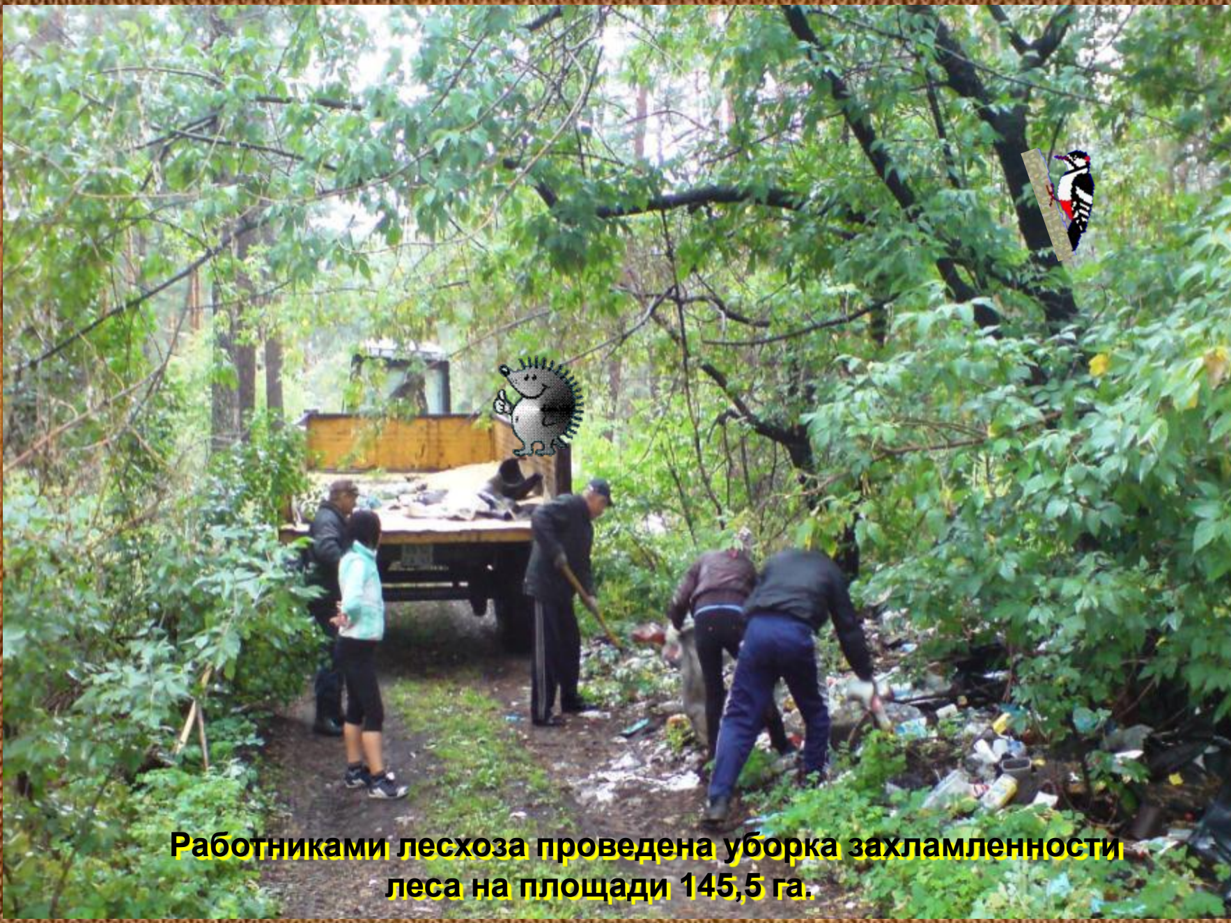
Работниками лесхоза проведена уборка захламленности леса на площади 145,5 га.