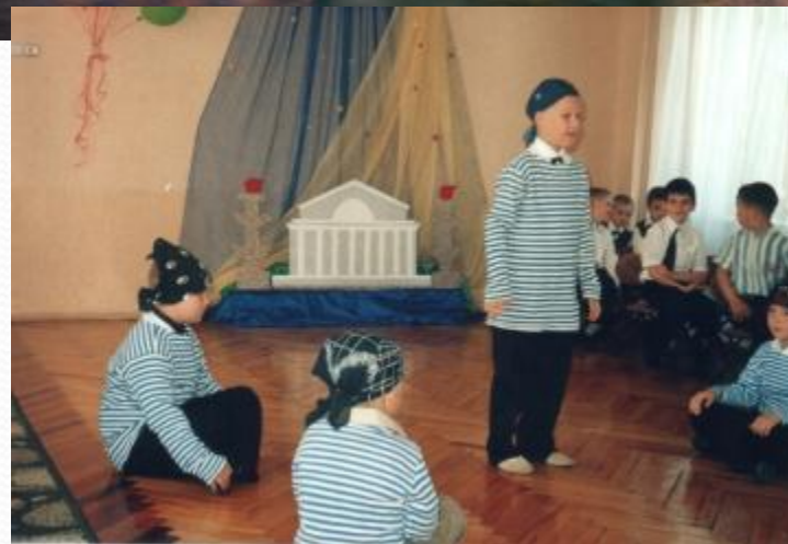
Танец «Морячок» Композиция Л.Кустовой