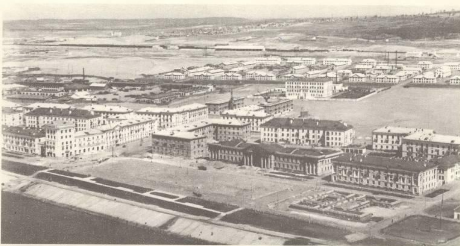
Застройка пос. Шлюзового. 50-е годы XX в.