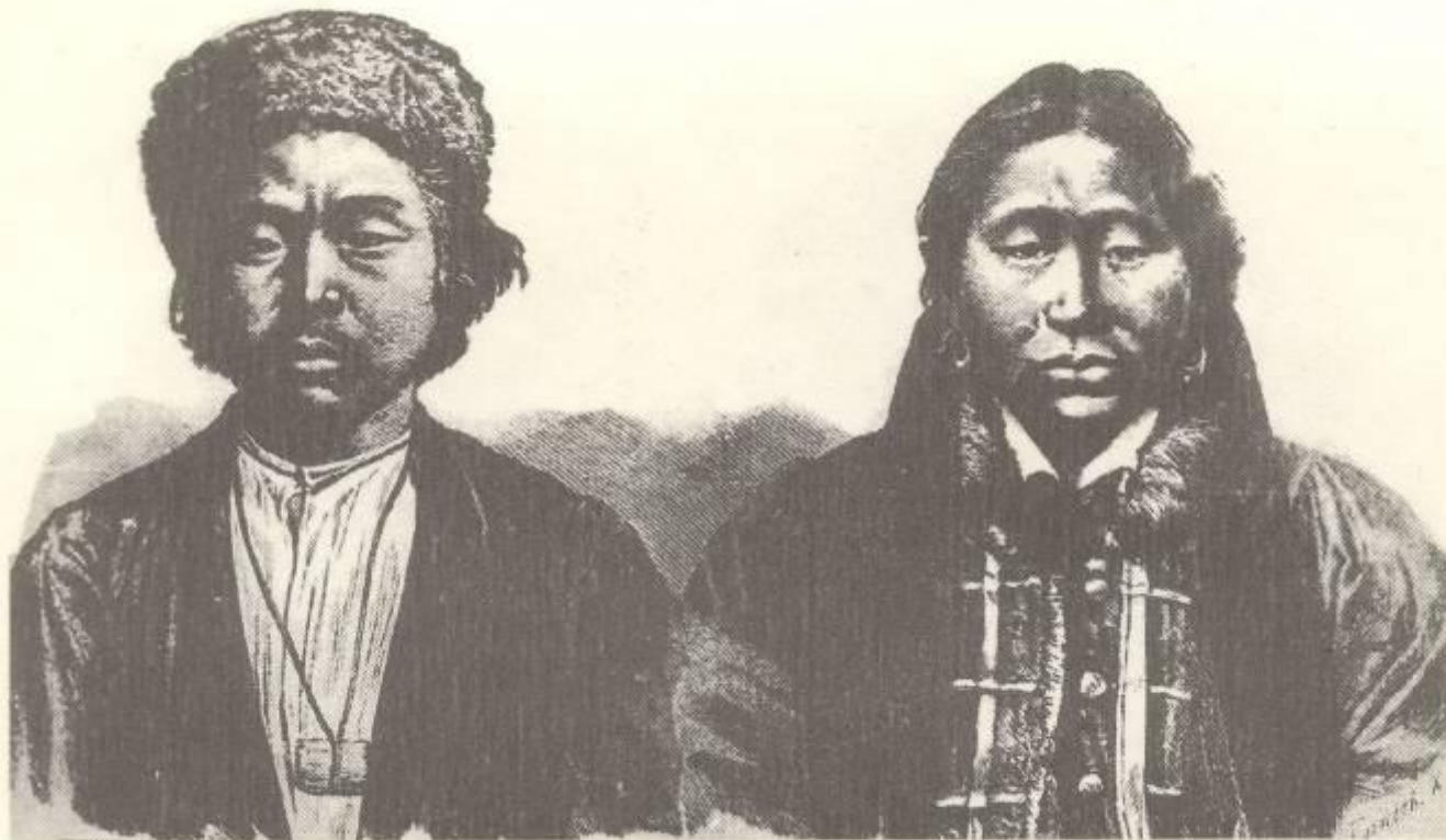
Калмыки. XVII в.