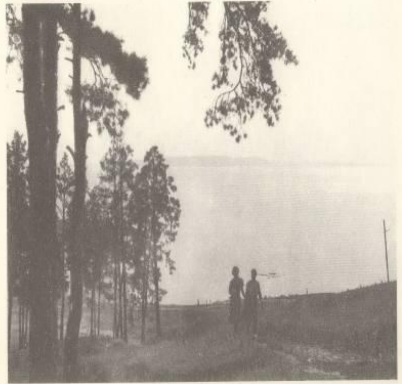
Место, где был г. Ставрополь. 60-е годы XXв.